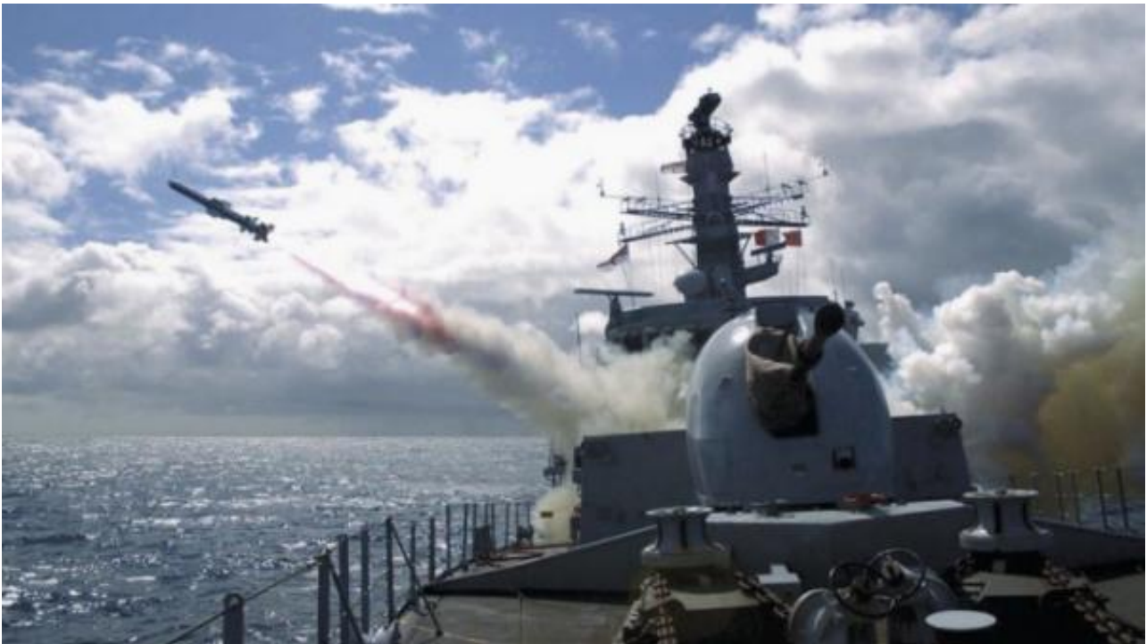
英国海军的“鱼叉”导弹

“鱼叉” Block 1C导弹是一种涡轮喷气发动机动力的掠海反舰导弹，该导弹射程约为130公里，使用雷达制导。