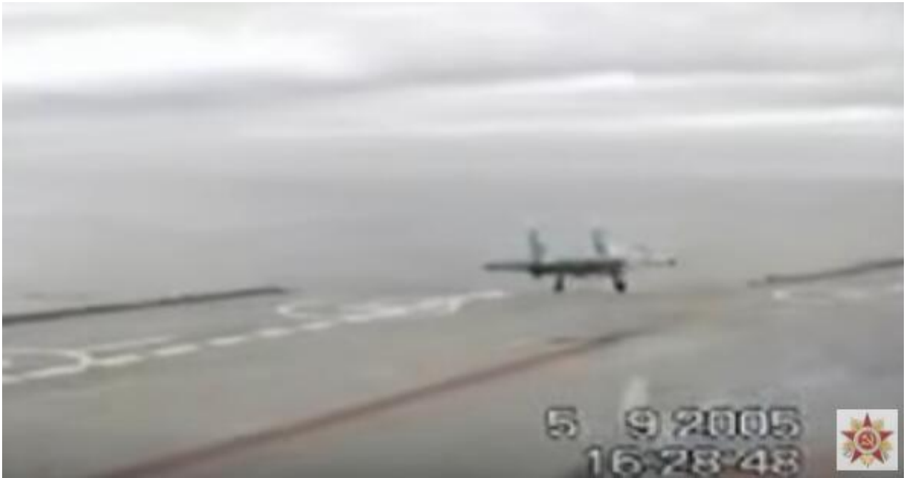
（资料图）2005年时一架苏-33舰载机因阻拦索断裂坠海

俄罗斯“库兹涅佐夫”号航母这次出击叙利亚从一开始就被负面消息纠缠，西方国家嘲讽冒着黑烟的俄罗斯航母是“重演第二太平洋舰队悲剧”（日俄战争期间俄将波罗的海舰队调往远东作战，结果遭到惨败）。继上月一架米格-29KUBR战斗机因航母阻拦索故障难以修复，耗尽燃油坠毁之后，12月3日，又一架俄罗斯苏-33舰载战斗机坠毁。事故原因据称是着舰时阻拦索断裂，飞行员弹射逃生，相关报道已经得到俄罗斯国防部确认。这次事故表明，俄罗斯“库兹涅佐夫”号航母确实存在带病参战的问题，其阻拦索系统很可能存在设计缺陷。中国“辽宁”号的阻拦系统是我国自行研制，与俄航母不同。