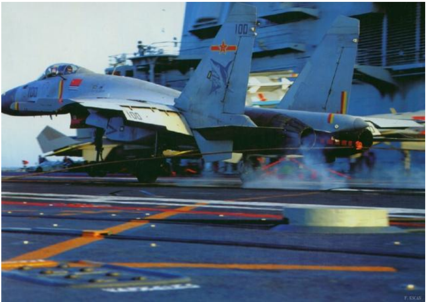
中国“辽宁”号航母的阻拦索系统是国内自行研制