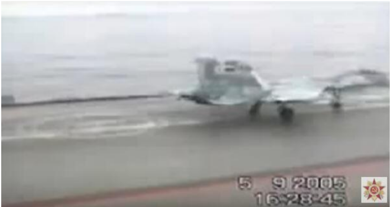
俄罗斯唯一的航母“库兹涅佐夫”号的阻拦索似乎并未彻底解决长期存在的技术问题