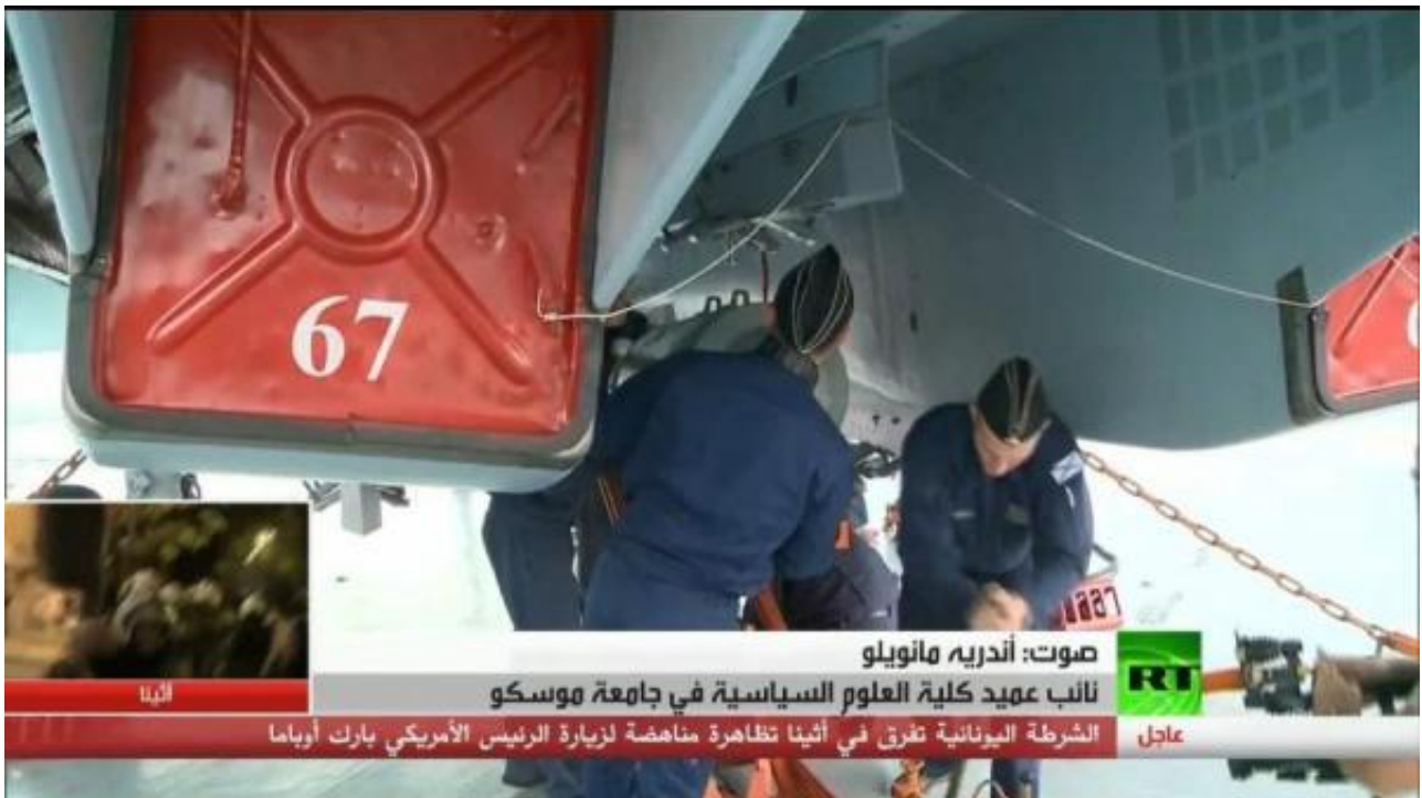
此次苏-33舰载机实施攻击的典型挂载是在机腹中心挂架携带两枚500公斤FAB-500铁炸弹

还有谁记得“库兹涅佐夫”是什么时候带着舰上的4架米格-29KR/KUBR战机从北莫尔斯克启航的呢？2016年10月14日。也就是说，这些舰载机实际上在经过一个月的上舰适应训练后，就开始了它们的第一次战斗巡航任务。如果想解放军舰载机部队那已经令人惊奇的“航母速度”，就知道这种仓促之下会有多少潜在的问题了。